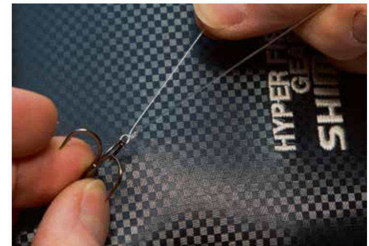
Stram tampen på den bagerste blodknude bagover, så den står vinkelret på taklet.

RELEASE-TAKLET MED SPRING-RINGE var en realitet, samme aften da jeg begyndte at eksperimentere på fiskekon-