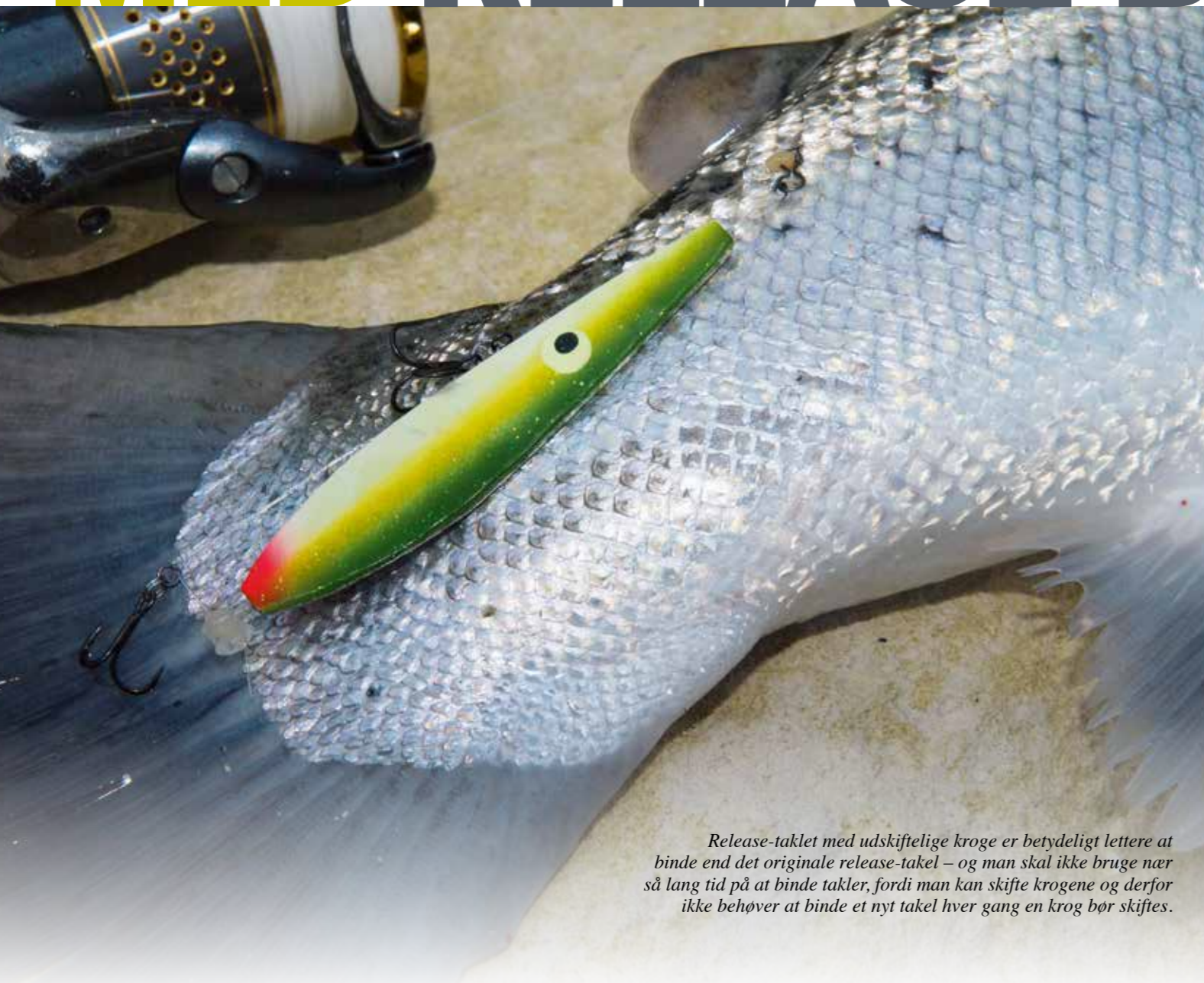
Release-taklet med udskiftelige kroge er betydeligt lettere at binde end det originale release-takel – og man skal ikke bruge nær så lang tid på at binde takler, fordi man kan skifte krogene og derfor ikke behøver at binde et nyt takel hver gang en krog bør skiftes.

Med et release-takel på blink eller kystwobler, hæver du landingsraten 50 % med én trekrog og 100 % med to trekroge på taklet. Nu er der kommet en ny version af release-taklet, som gør det betydeligt lettere at binde – samtidig med, at man kan nøjes med langt færre takler, fordi krogene kan skiftes let og hurtigt.