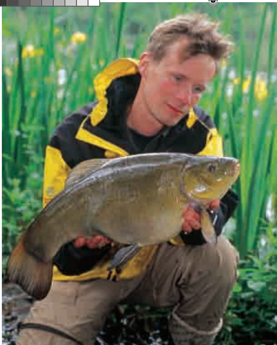
Geloof het of niet, maar deze kneiter pakte een met maden beaasd haakje 12.

je toch casters gebruiken, dan dien je voor haken in de maat 16 tot 12 te kiezen, hetgeen in sommige wateren wel eens aan de lichte kant zou kunnen zijn, vooral als je een echt grote zeelt haakt.