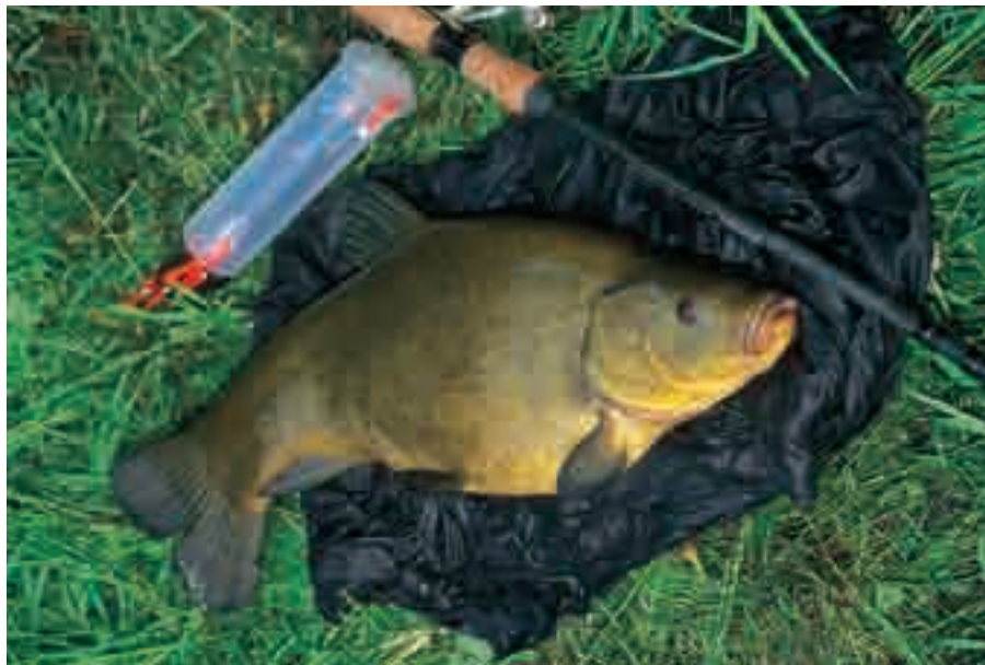
Gevangen aan een trosje wormen.

Wormen zijn het klassieke aas voor zeelt, maar tegenwoordig helaas een beetje in vergetelheid geraakt. De reden daarvoor kan zijn dat mensen tegenwoordig geen tijd meer hebben om zelf wormen te spitten of te kweken. Gelukkig zijn er inmiddels in de meeste goed gesorteerde hengelsportzaken weer volop goed levendige wormen te koop. Natuurlijk is maïs een stuk handiger, maar toch zul je vaak ontdekken dat het de worm is die de zeelt vangt, terwijl maïs nauwelijks resultaten oplevert. Het is ook zeker aan te bevelen om een aantal wormen in stukjes te snijden en door het voer te mengen. Kleine wormen aan haak 10 tot 12 scoren vrijwel altijd, maar naar mijn ervaring krijg je meer aanbeten, wanneer je juist wat grotere exemplaren gebruikt. Bedenk u wel dat je bij het vissen met grote aas iets