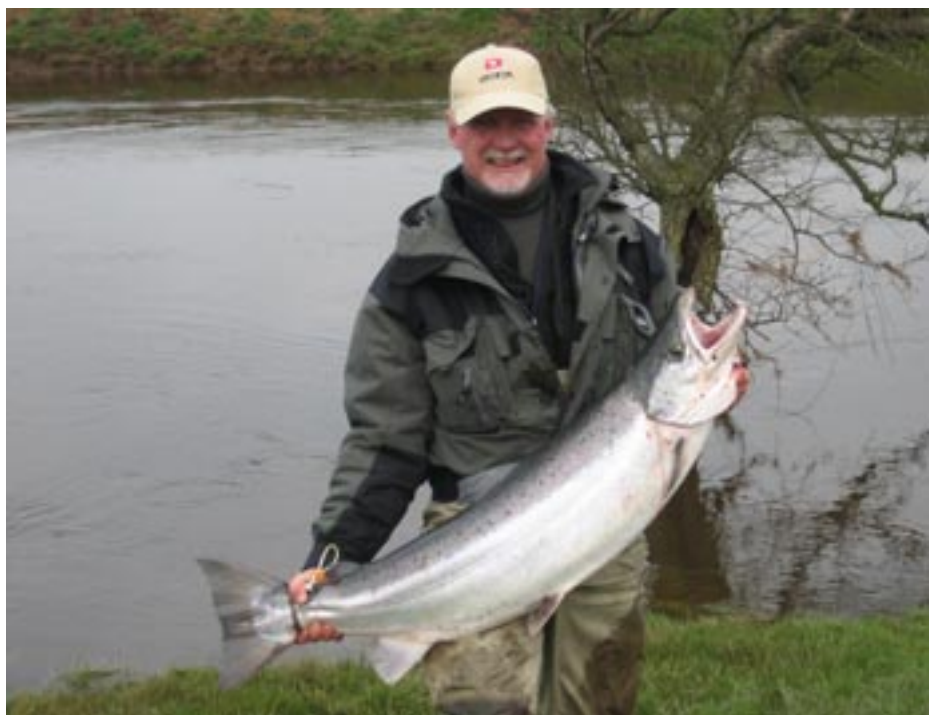
XXXX XXXX X XXXXX XX XXXX XXX XX XXXX XX XXXXX XXX.a

» DEN STÖRSTA FISKEN FÖRRA SÄSONGEN VÄGDE HELA 16,5 KILO OCH VAR EN BLANK HANFISK.