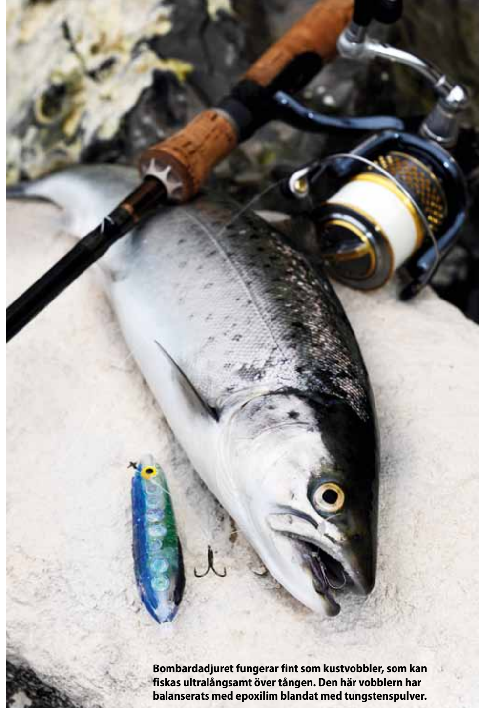
Bombardadjuret fungerar fint som kustvobbler, som kan fiskas ultralångsamt över tången. Den här vobblern har balanserats med epoxilim blandat med tungstenspulver.

Vätskan inuti Bombardadjuret kan varieras för att justera densiteten eller för att skapa speciella färgeffekter.