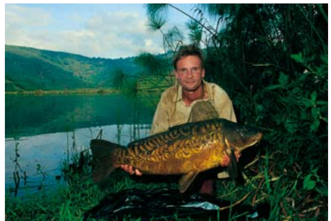
High van geluk vanwege m'n eerste afrokarper

High van geluk vanwege m'n eerste afrokarper kon ik met behulp van m'n kaarslicht de schitterende, gespierde spiegelkarper wegen. Hij woog 12 kg. De vis werd gezakt en voldaan met het resultaat pakte ik alles in en peddelde ik naar het papyrusmoeras. De maan zakte langzaam weg achter de bergen en stilletjesaan begon de dag. Met een zwak geritsel kwam er zwarte ral te voorschijn en sprong op de rand van de nu waggelende boot. Onvoorbereid op de situatie balanceerde hij op z'n lange